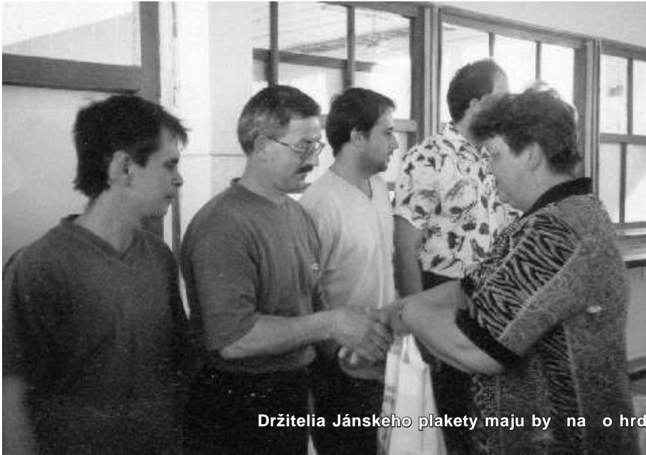
Držitelia Jánskeho plakety majú by na o hrdí