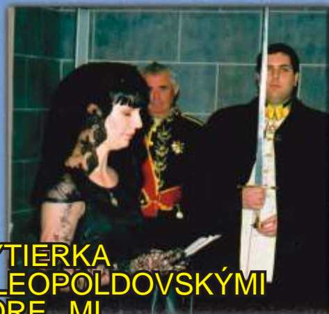
RYTIERKA S LEOPOLDOVSKÝMI KOREMI