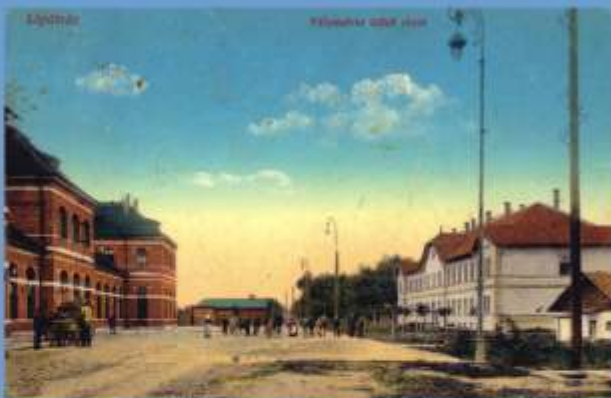
Budova železničnej stanice