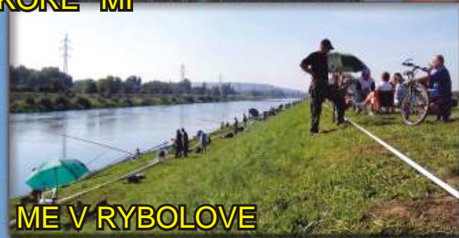
ME V RYBOLOVE