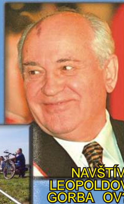
NAVŠTÍVIL LEOPOLDOV GORBA OV