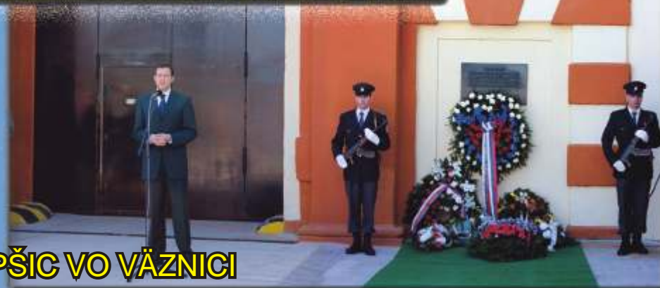
LIPŠIC VO VÄZNICI