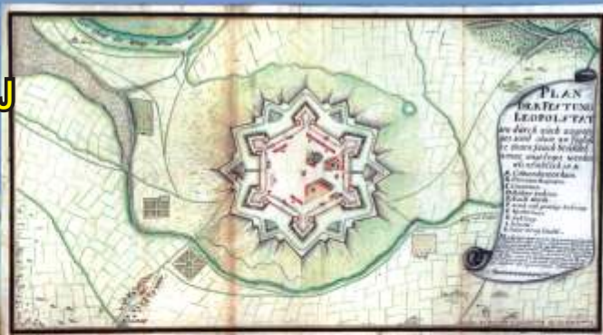
Plán pevnosti Leopoldov z roku 1700