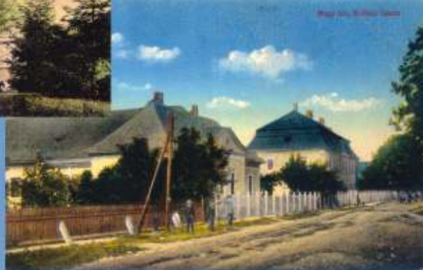
Budova školy v miestach dnešného liehvaru?

V roku 1665 začali robotníci pri nešnom Leopoldove stavať obrannú pevnosť. Netušiac, že sa tu neskôr stanú prvými osadníkmi novovznikajúceho mesta, budovali v tomto aristokratickej oblasti múry, ktoré po niekoľkých nájazdoch neskôr obišli aj obávaní Turci. Pred tristoštyridsiatimi rokmi sa tu dialo, čo zmenilo dejiny nášho mesta, ktoré neodmysliteľne súvisia s niekdajšou protitureckou pevnosťou a terajšou väznicou. Jej dnešná tvár je nám všetkým dobre známa. Pozrime sa, ako to v Leopoldove vyzeralo v minulosti. O staré pohľadnice sa s nami