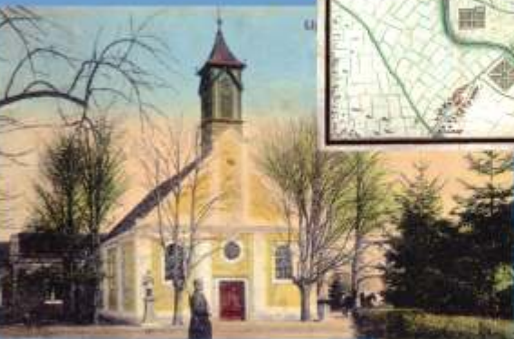
Kostol v pevnosti

V roku 1665 začali robotníci pri nešnom Leopoldove stavať obrannú pevnosť. Netušiac, že sa tu neskôr stanú prvými osadníkmi novovznikajúceho mesta, budovali v tomto aristokratickej oblasti múry, ktoré po niekoľkých nájazdoch neskôr obišli aj obávaní Turci. Pred tristoštyridsiatimi rokmi sa tu dialo, čo zmenilo dejiny nášho mesta, ktoré neodmysliteľne súvisia s niekdajšou protitureckou pevnosťou a terajšou väznicou. Jej dnešná tvár je nám všetkým dobre známa. Pozrime sa, ako to v Leopoldove vyzeralo v minulosti. O staré pohľadnice sa s nami