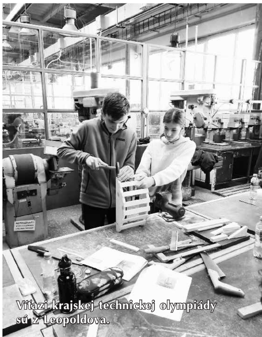
Víťazi krajskej technickej olympiády sú z Leopoldova.

Pripravili vedúci zamestnanci MZ, PK, ŠKD, školská psychologička