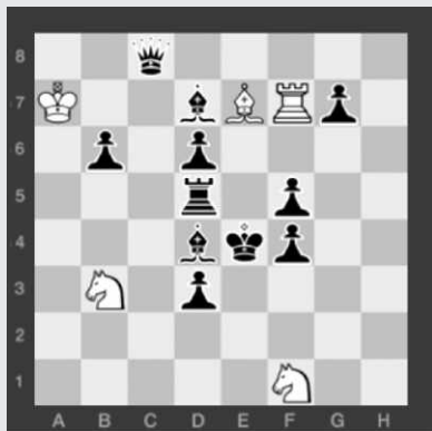
Mat 10. tahom (5 - 11)