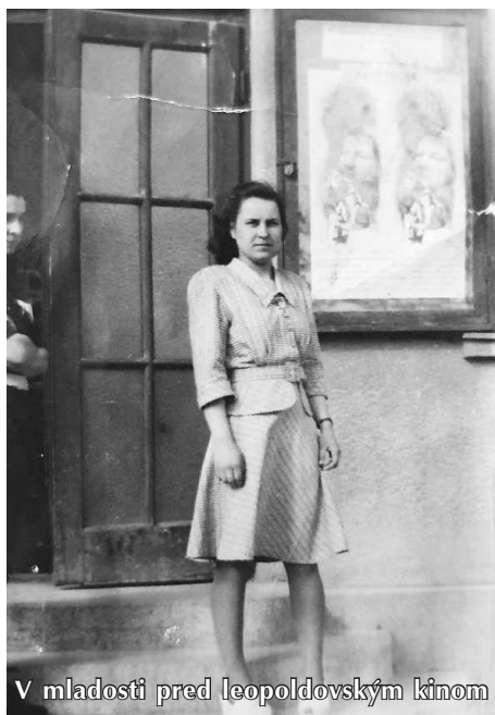
V mladosti pred leopoldovským kinom