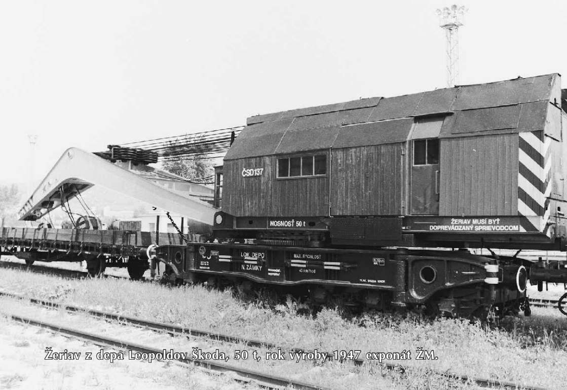
Žeríav z depa Leopoldov Škoda, 50 t, rok výroby 1947 exponát ŽM.