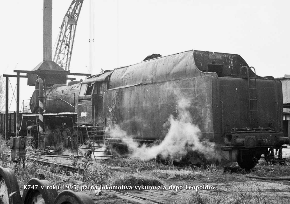
K747 v roku 1995, parná lokomotíva vykurovala depo Leopoldov.