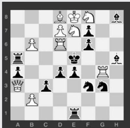
Mat 2. ťahom (10 - 13)

1.čestné uznanie, Labai 60 JT C 31. 12. 2002