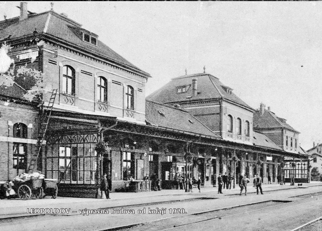
LEOPOLDOV – výpravná budova od kolají 1920.