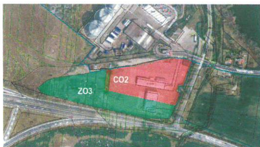
Súčasný platný ÚPN mesta Leopoldov

Táto zmena bola schválená na Mestskom zastupiteľstve v Leopoldove dňa 16.8.2021.