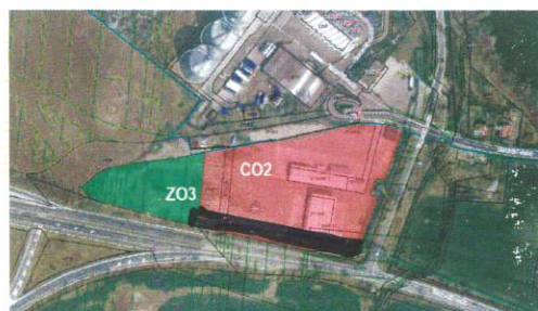
Navrhovaná zmena ÚPN mesta Leopoldov

C02 – Plochy a bloky priemyselnej výroby, výrobných služieb a stavebnej výroby