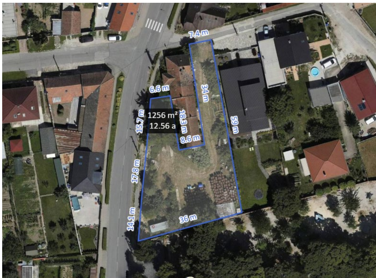
Príloha č. 1: Grafické vyjadrenie záujmového územia