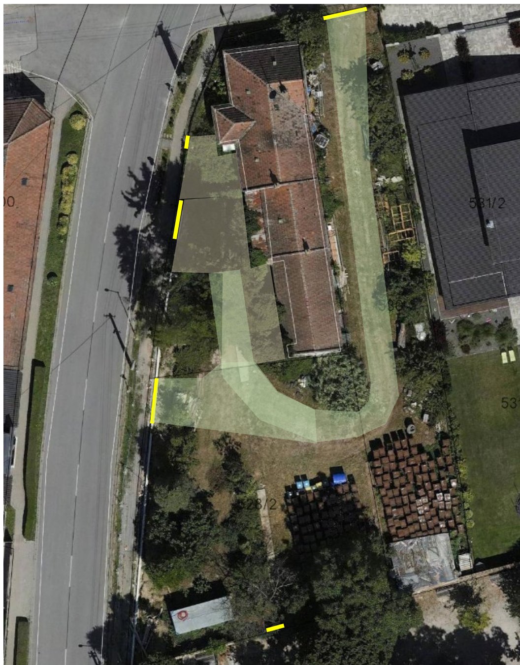
Príloha č. 3: Grafické znázornenie spevnených a odkladacích plôch prislúchajúcich k rodinnému domu